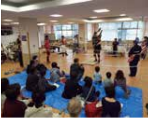
信州プロレスリング

5月13日(土)に第13回病院祭を開催しました。南長野医療センター新町病院として初めての開催となった今回の病院祭は、地元信州新町「犀流太鼓」のみさんによる迫力ある演奏で幕を開けました。