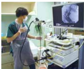
胃カメラのチェック

内視鏡センターでは皆さん嫌いな検査の一つ胃カメラが行われています。私は胃カメラの洗浄を主に行っており、検査前の説明、患者さんが苦しくないように喉の奥に麻酔をかける前処置の介助も行います。