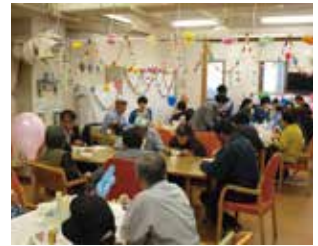
とん汁サービスも大盛況