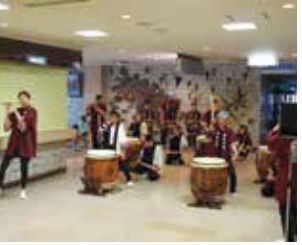
地元信州新町の犀流太鼓の演奏