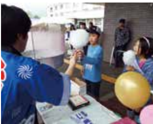
子ども広場も賑わいました