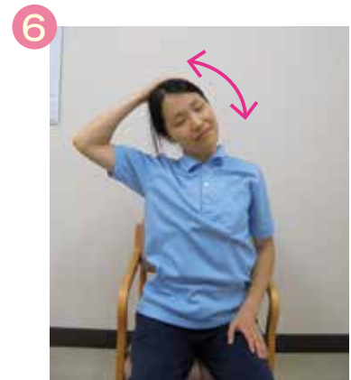
上体を動かさずに首だけ曲げる(左右)

まずは立つ習慣をつけましょう。いつまでも健康で楽しく生活していくために、高齢者も、子供も、働く人も、「座り過ぎてはいけない」という意識を持って生活するようにしてみてください。