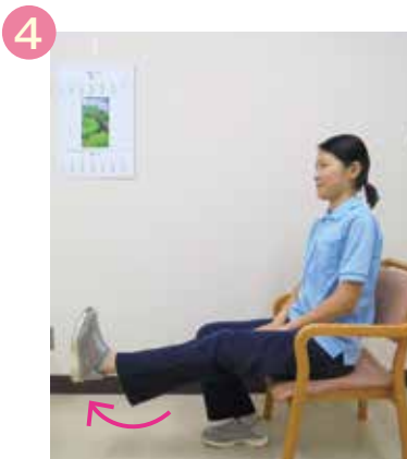
片足ずつ膝を伸ばす