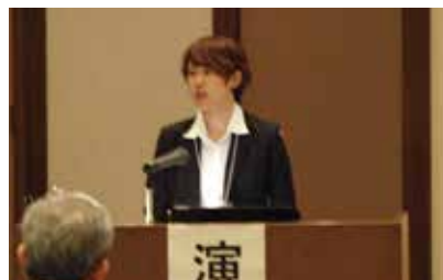
今回当院では本郷院長と2名の看護師が発表しました。