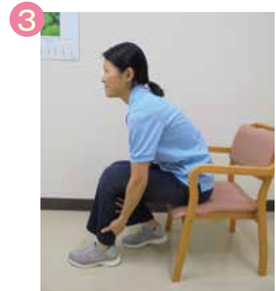
ふくらはぎを軽く揉む