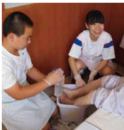
小川中学校の学生さん 患者さんの足浴を体験しました。