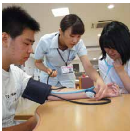
篠ノ井高校犀峽校の学生さん 血圧計を使用して実際に血圧を測りました。