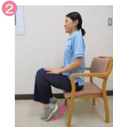
かかとを引き上げる